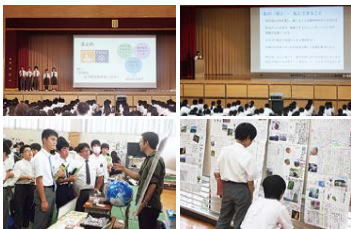
2019年度総合的な学習の時間 (ER) 年間指導計画