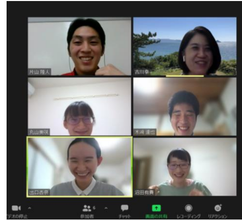
オンライン会議の様子

これにより、学生は企業の取り組みや企画立案・プレゼン発表の仕方を学ぶことができるとともに、企業には学生目線での新規アイデアを提供することができる。また昨年度の開講により連携が続いている企業もあり、SDGsの取り組みに向けた協働が効果として期待される。