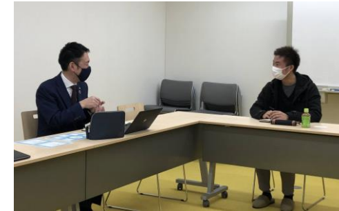
企業との打ち合わせ